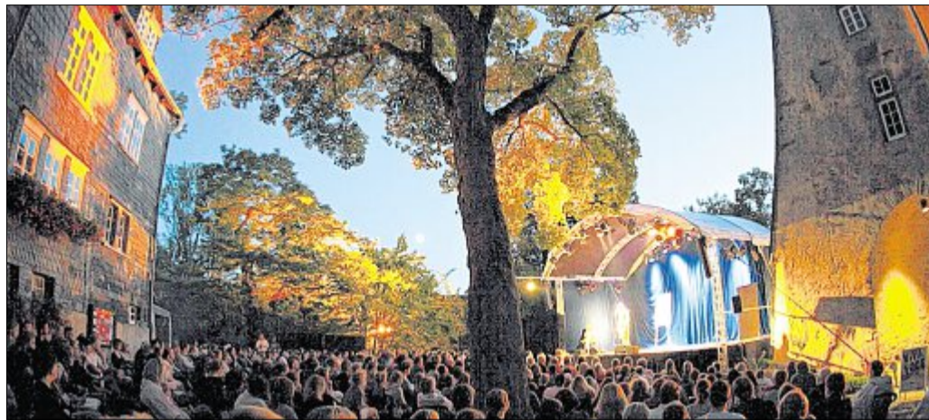
Der alljährliche Dichterwettstreit im Innenhof des Oberen Schlosses ist besonders beliebt. Demnächst wird in Siegen gefeiert, der erste Poetry Slam fand hier vor zehn Jahren statt.

Vor zehn Jahren fand der erste Poetry Slam in Siegen statt